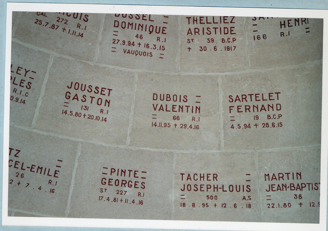
A L'ossuaire de Douaumont