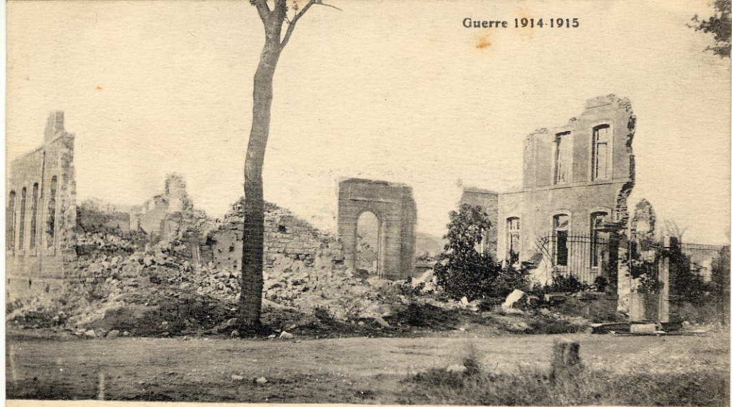
Bombardement de PONT à-MOUSSON