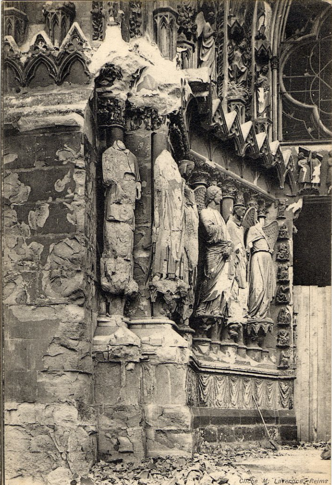
308 - GUERRE EUROPÉENNE 1914. — Le Chêne de Reims. Statues de la Façade principale de la Cathédrale après le bombardement par les Allemands The Crime of Reims. — Statues of the Front of the Cathedral.