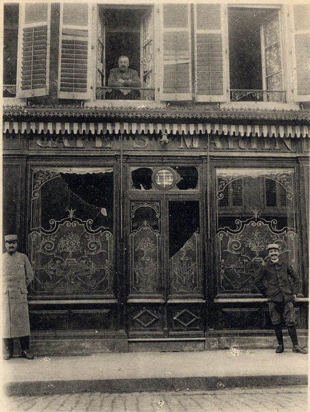
PONT-à-MOUSSON. - 1914-1915