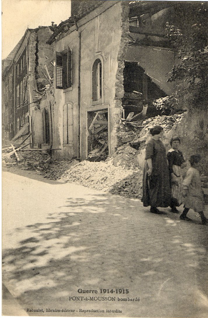
Guerre 1914-1915 PONT-à-MOUSSON bombardé