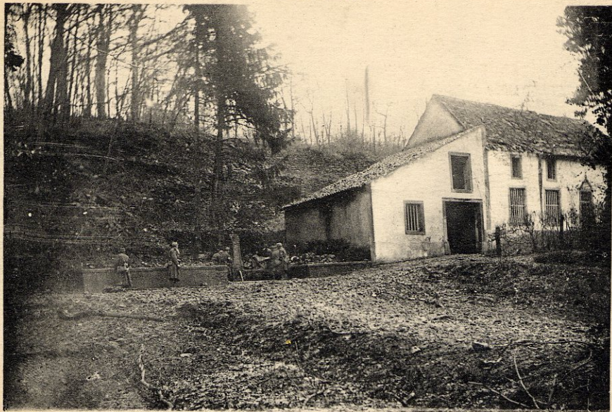
PONT-à-MOUSSON. - Fontaine du Père Hilarion

Reboulet, libraire-éditeur - Reproduction Interdite