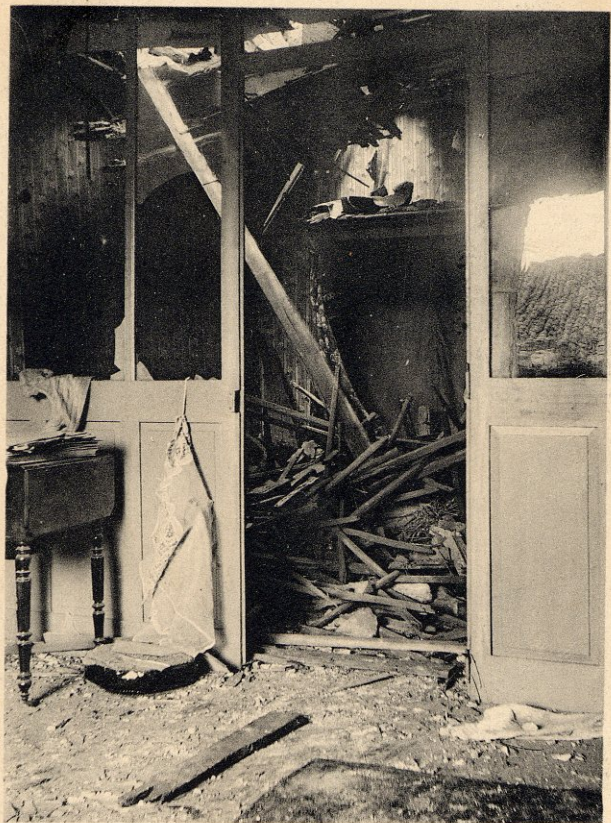
PONT-A-MOUSSON. - 1914-1915 - Chambre à coucher bombardée