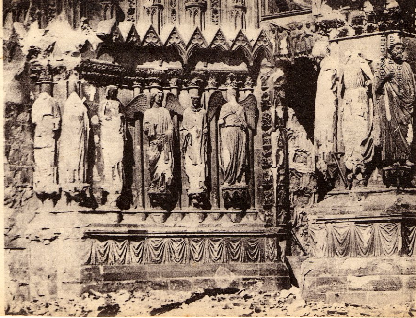
La Cathédrale après le bombardement.