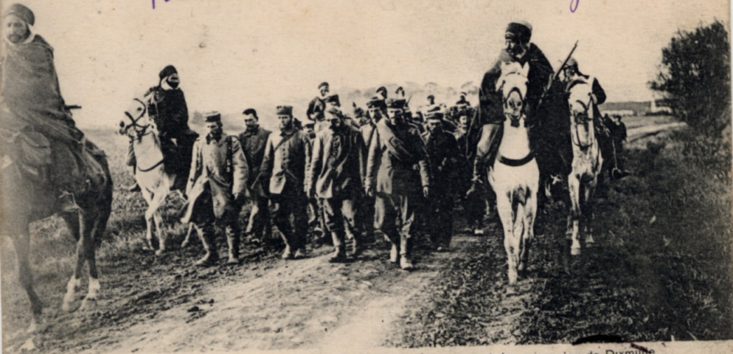
La Guerre de 1914, L. C. H. Paris

Prisonniers Boches avec de bons gardiens